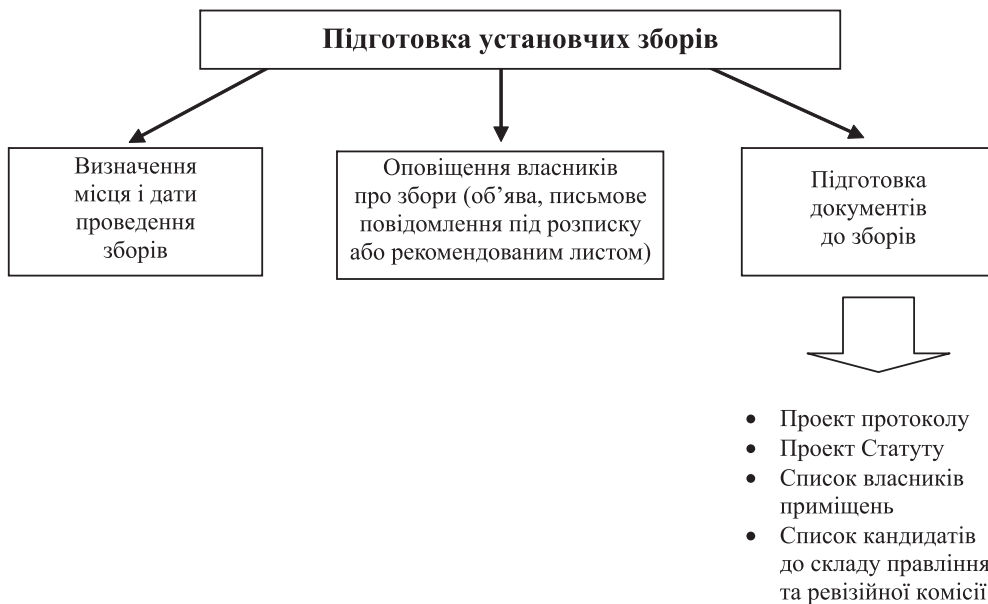
Рисунок 2. Підготовка установчих зборів