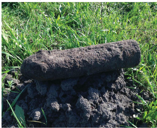
Відлуння минулої війни.