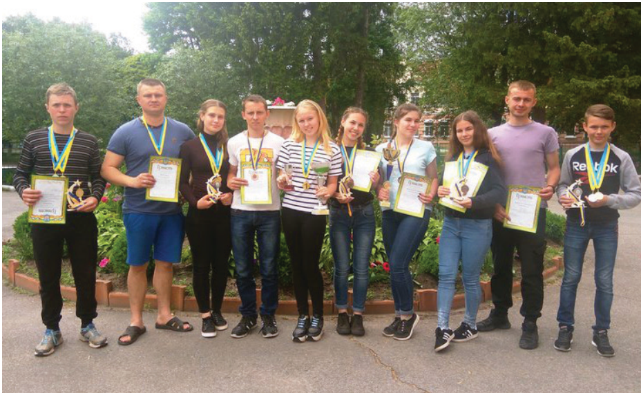
На фото: «Адреналін» вже у крові талалаївських туристів.

Засновник і видавець: Товариство з обмеженою відповідальністю «Трибуна плюс».