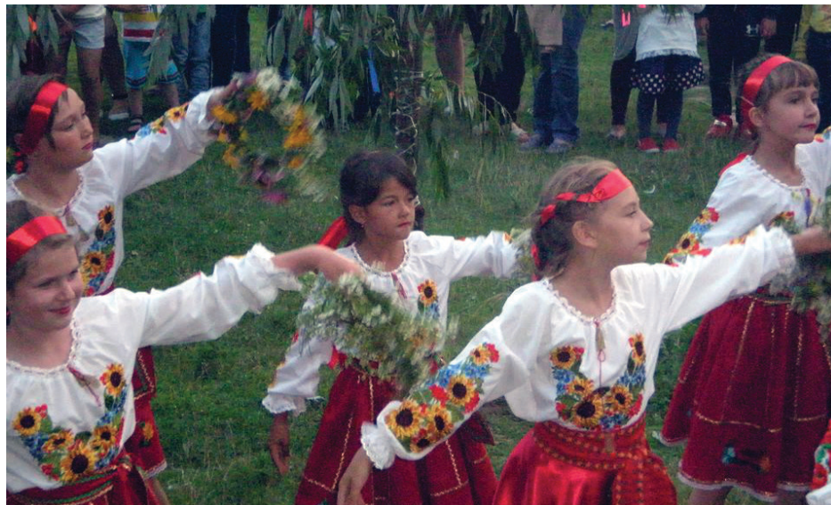
На фото: святкування Івана Купала в Талалаївці.