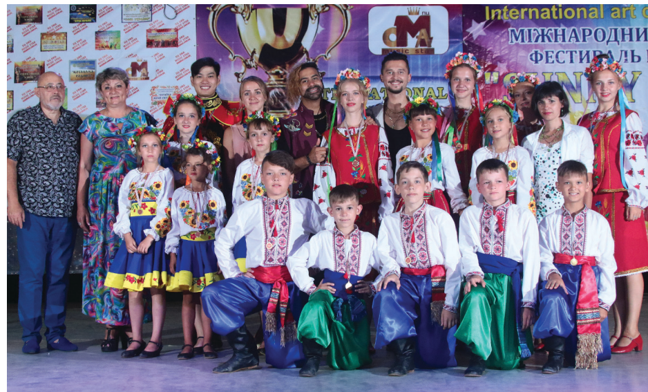
На фото: «каскадівці» із зірковим журі.

Не зволікайте і потурбуйтеся про придбання обладнання завчасно.