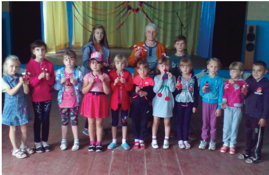
На фото: корінецькі діти цікаво проводять канікули.