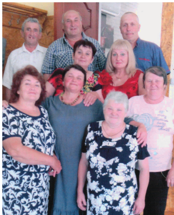
На фото: випускники Корінецької восьмирічки цього літа знову зустрілися.