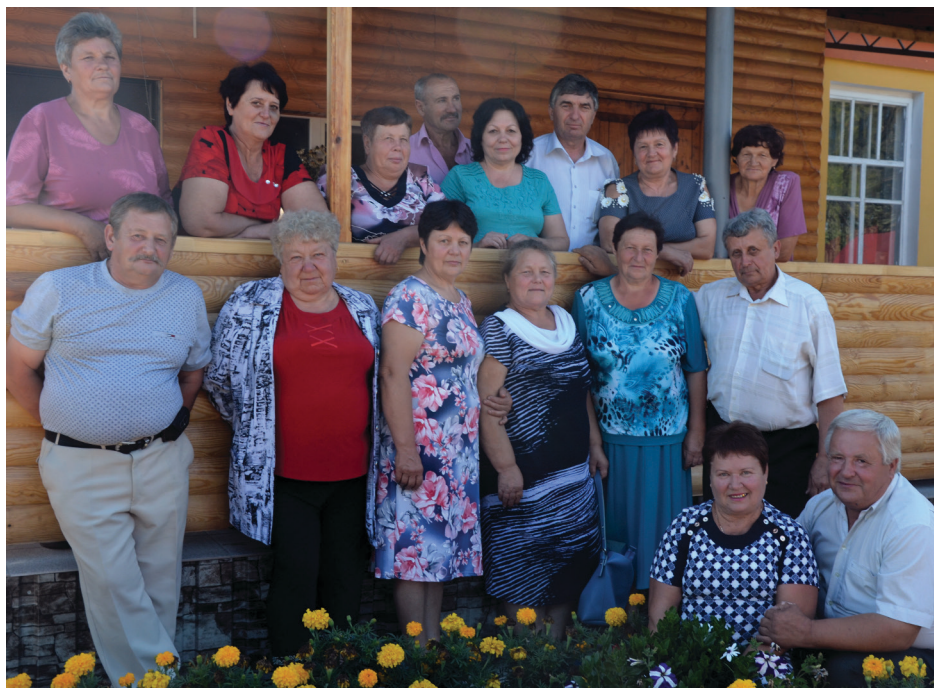
На фото: зустріч через 45 років після закінчення Болотницької середньої школи.