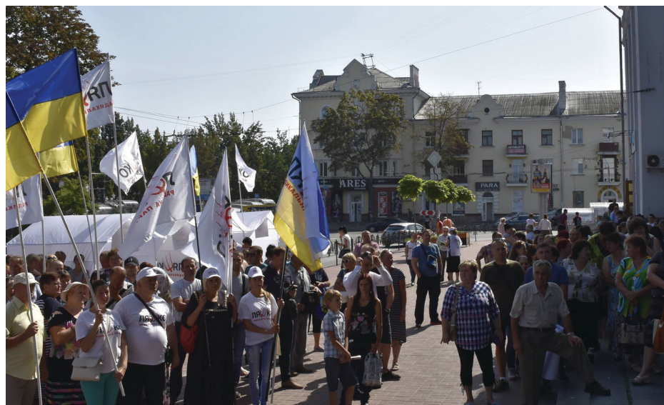
На фото: під час акції біля приміщення «Укрпошти» в Чернівці.

змін до закону України «Про забезпечення комерційного обліку природного газу». На сайті Національної комісії, що здійснює державне регулювання у сферах енергетики та комунальних послуг (НКРЕКП), можна знайти рекомендації щодо встановлення газових лічильників побутовими споживачами згідно із Законом. Однозначно, споживач має право обрати, придбати та встановити газовий лічильник. Ці процедури повинні відбуватися згідно із діючим Законом, а не бажаннями окремих осіб.