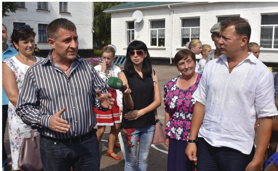
На фото: народний депутат України Олег ЛЯШКО (праворуч) та голова ЧТО РПЛ Олег АВЕР'ЯНОВ під час зустрічі з працівниками Укрпошти в Комарівці.

Заміна сільських поштових відділень автомобілями не влаштовує перш за все селян.