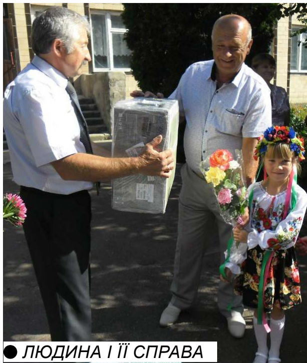
● ЛЮДИНА І ЇЇ СПРАВА