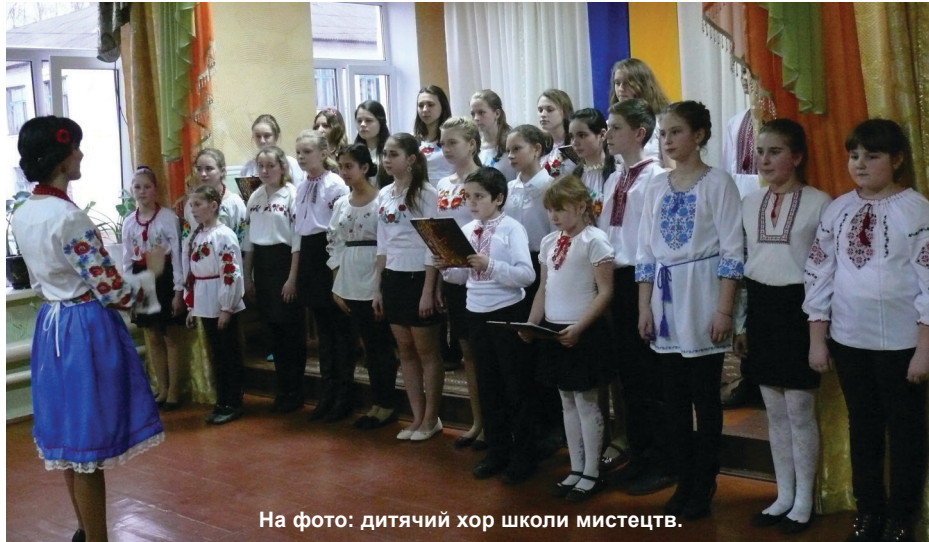
На фото: дитячий хор школи мистецтв.

Є впевненість, що традиції продовжуватимуться, адже