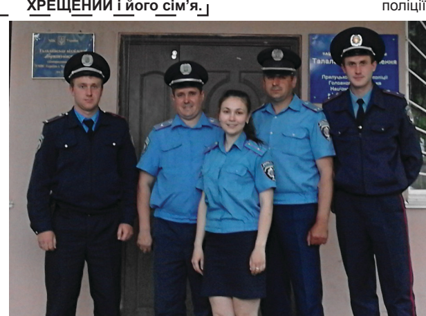
На знімку: колектив сектору талалаївських дільничних інспекторів поліції.