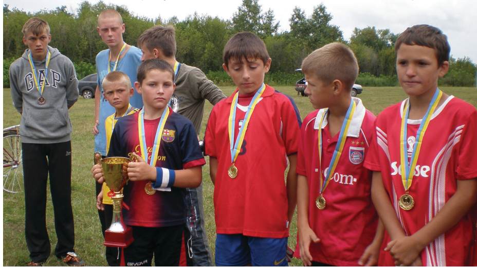
На фото: переможці турніру — юні учасники футбольної команди з Понір.