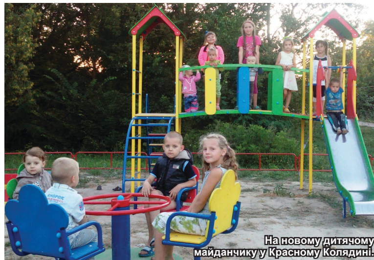
На новому дитячому майданчику у Красному Колядині.