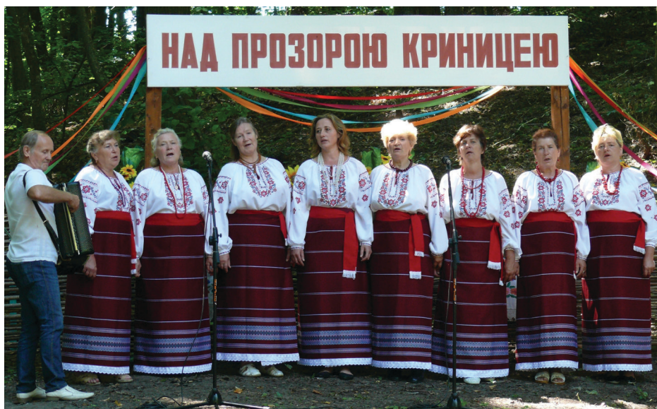
Жіночий вокальний ансамбль «Горлиця» Сильченківського СБК.

БАГАТО чого довелося побачити маленькому струмочку за свою невеличку дорогу до Плугатарського парку. Бачив він кришталеву красу сніжнок, милувався останнім танцем пожовклих листочків, відчував тепло перших променів сонця і насолоджувався співом негавомних пташок. Вбирав у себе все найкраще і черпав від природи тільки найкраще. Тому і приходять до нього люди напитися чистої води. А кожного 5 серпня зустрічає він біля себе багато гостей, що з'їжджаються з різних куточків району, та