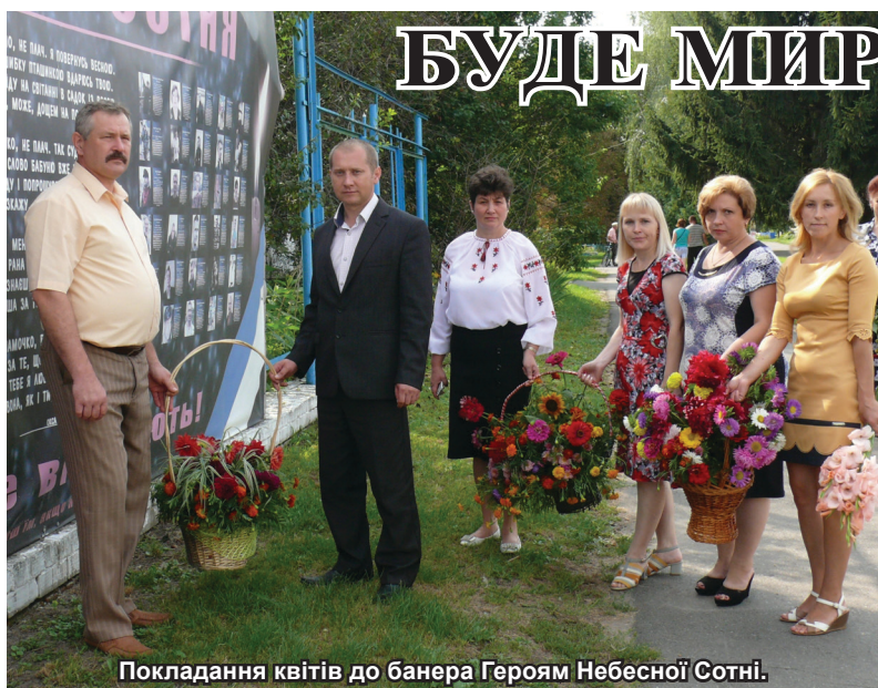
Покладання квітів до банера Героям Небесної Сотні.