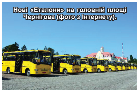
Нові «Еталони» на головній площі Чернігова.