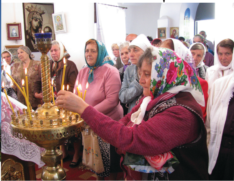
Під час служби.

ЦЯ ДАТА для жителів Липового стала подією в житті села. Теплого сонячного вересневого четверга до Спасо-Преображенської церкви ішли і їхали люди. Завітали сюди сусіди з Понір, Корінецького, Красного Коляди, Скороходового, Талалаївки. І літніх, і зовсім маленьких у цих святих стінах об'єднало урочисте відзначення 10-ї річниці від часу освячення сільського храму.