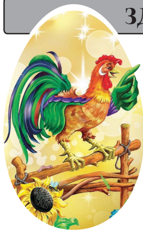
Півень — символ 2017-го року за східним календарем.

ЗДРАСТУЙ, 2017-й! МИРУ, ДОСТАТКУ, БОЖОГО БЛАГОСЛОВЕННЯ!