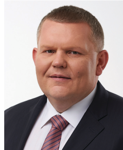
Широ Ваш — народний депутат України Валерій ДАВИДЕНКО.

Нехай у вашому житті панують радість і удача! Щасливого Нового року та Різдва Христового!