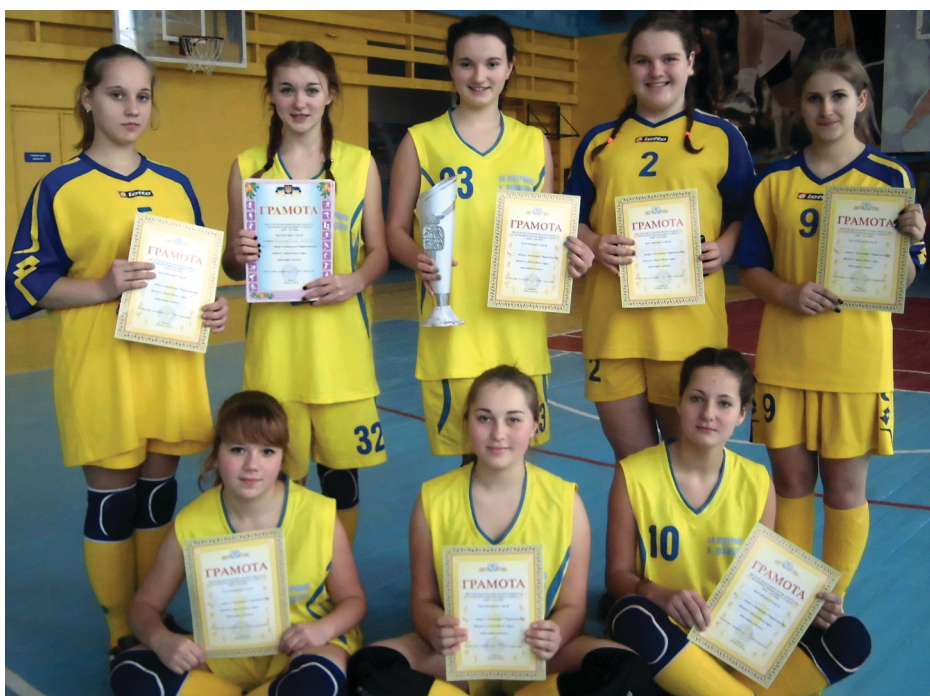
На фото: баскетбольна команда Плугатарської школи, чемпіон області серед дівчат.

Він проходив якраз напередодні Різдва в Чернігові і зібрав найсильніші дівочі команди області. Перший же поєдинок фінальної частини змагань звів, як потім виявилось, головних претендентів на чемпіонство. Чомусь так виходить, що старт для наших дівчат завжди видається важким. І баскетболістки з менської Березної сповна скористалися цією їхньою вадою. У плугатарчанок м'яч ніяк не хотів залітати до кошика. Однак, врешті-решт, все стало на свої місця, і фінальний свисток судді зафіксував перемогу наших — 37:10. Далі їх уже