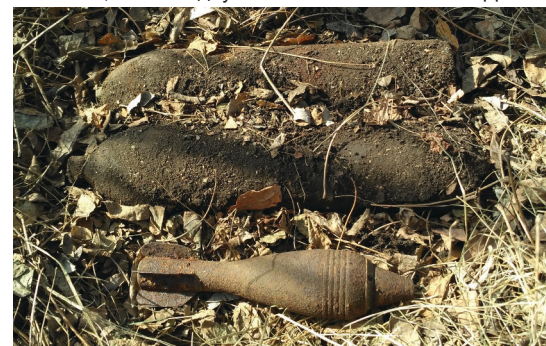
На фото: загрозові «подарунки» війни.

Валентин ПРОКОПЕНКО, провідний фахівець РС УДСНС.