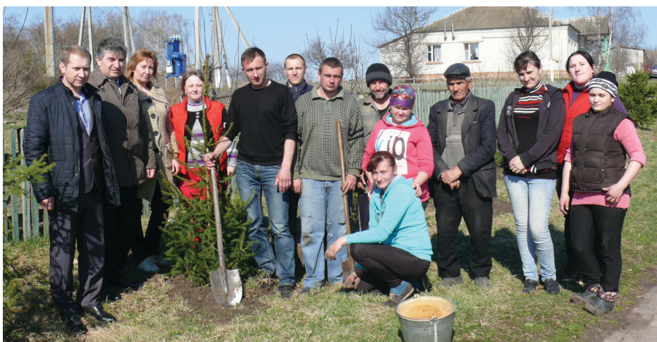
Вони саджали ялини на «Алеї миру» в Понорах.

Добрим прикладом у цьому плані вже багато років є Понори. Село невелике, але має воно впорядкований сільський центр. Уже кілька років тому звели на вигоні біля приміщення сільради велику клумбу, на якій постійно насаджують квіти, порядкують працівники сільради, культури, освітніх закладів. Із часом люди звикли до того, що центр села — не для випасу гусей. Тут повинно бути чисто і красиво. Працюючи сільським головою, Анатолій Дупа, який нині очолює райдержадміністрацію, разом із сільськими активіста-