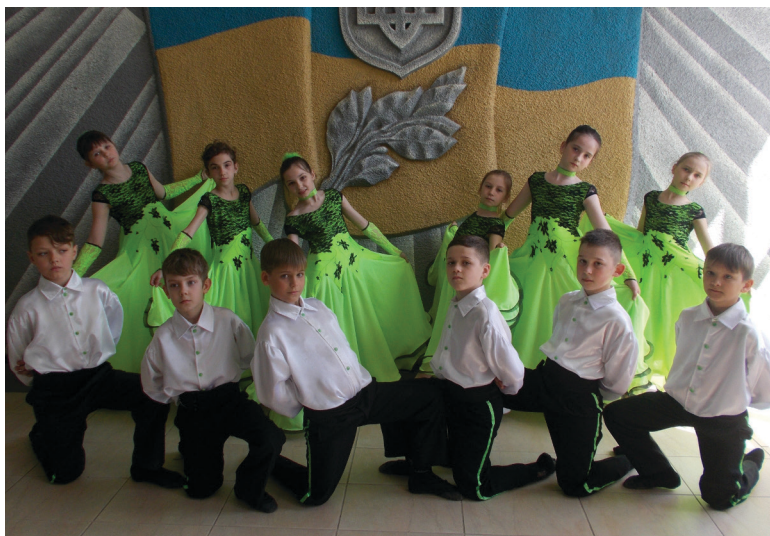
На фото: середня вікова група.