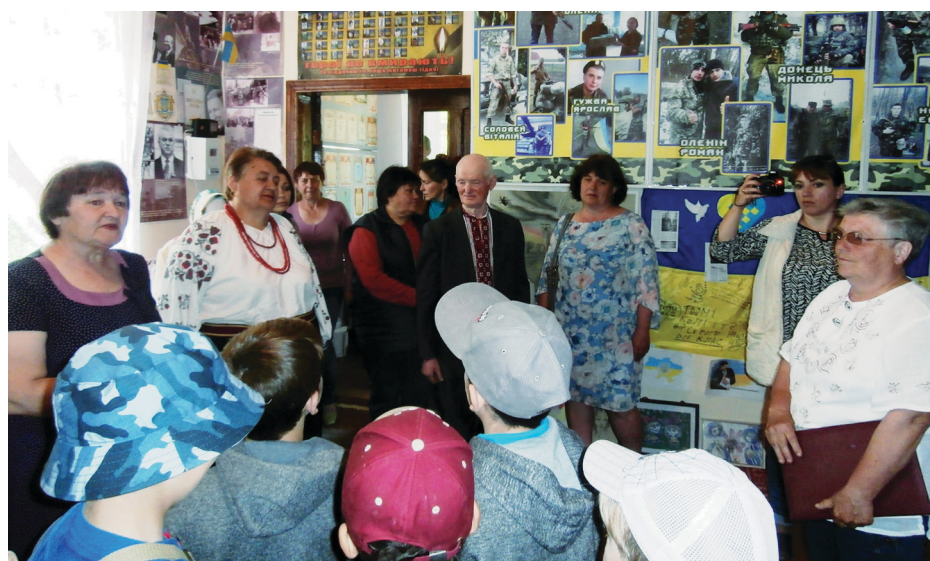
На фото: живе спілкування журналістів з читачами райгазети і відвідувачами музею.

Керівники області були відкриті до спілкування і відповідали на всі, навіть незручні чи неприємні для них запитання. Наприклад, про найбільш дошкульний критичний матеріал чи співмірність особистістю та по-