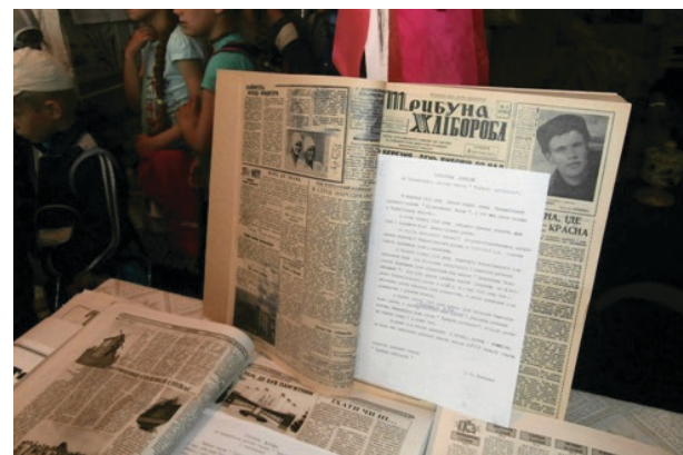
На фото: викладка «Трибуни» минулих років у залі музею.

Передплатуйте і читайте свою улюблену газету.