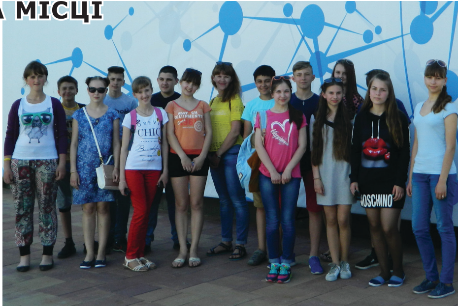
На знімку: талалаївські школярі під час відвідин інноваційного містечка UNIT.City в Києві.

Читаючи статті про розвиток науки та технологій, я натрапила на інформаційний сайт, який розповідав про сучасну кардинально нову модель навчання, про містечко, яке є натхненням для програмістів, місцем роботи і навчання, що відкрите в Україні та сприяє розвитку сфери послуг у IT-галузі. Інформації в мережі було багато. Писалося і про головного інвестора проекту Василя