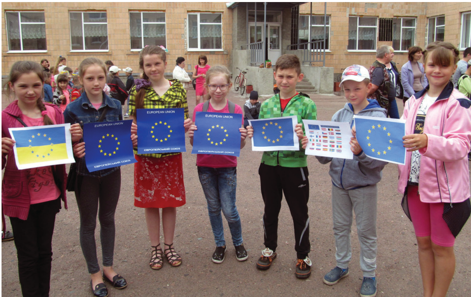
На фото: флешмоб, присвячений безвізу, в таборі «Романтик».

Під гаслом «Майбутнє дитини — майбутнє України» фахівцями відділу сприяння зайнятості у Талалаївському районі Срібнянського районного центру зайнятості на базі пришкольнього пристосованого табору «Романтик» був проведений профорієнтаційний захід для дітей. Учні в пізнавально-ігровій формі — у вигляді профорієнтаційних ігор, загадок, конкурсів мали