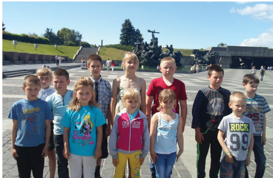
СЛУЖБА – 102

Прес-служба Чернігівської обласної партійної організації ВО «Батьківщина».