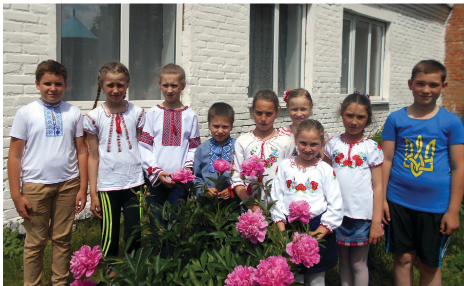
На фото: вихованці табору «Сонечко» на подвір'ї школи.

Прес-служба Чернігівської обласної партійної організації ВО «Батьківщина».