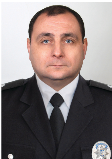
ставлення населення до роботи поліцейських?

— Безперечно. Все більше людей довіряють роботі поліцейських, ідуть з нами на співпрацю, що дозволяє знизити рівень злочинності. Останнім часом у нас не помітно резонансних злочинів. Та й ставлення поліцейських до людей сьогодні зовсім інше — люди відчують підтримку від правоохоронців, а не стремління до приниження особи чи її покарання.