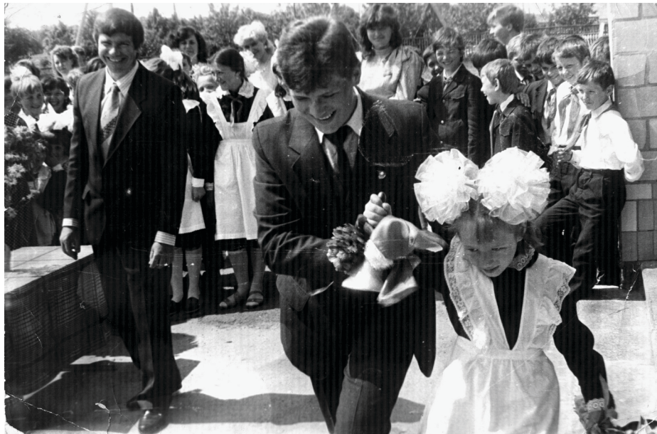
момент із свята Першого вересня в Липівській школі 30 років тому.