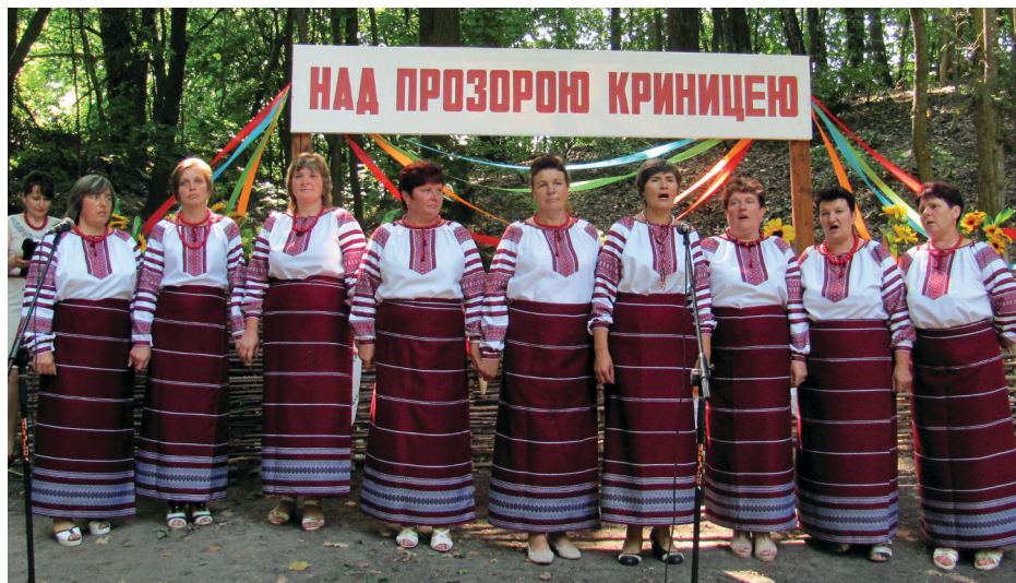
На фото: священики окропили людей водою із криниці (ліворуч); виступає жіночий вокальний ансамбль «Калина» Українського СБК.