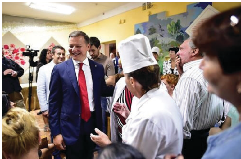
На фото: колектив лікарні тепло зустрічає Олега ЛЯШКА.