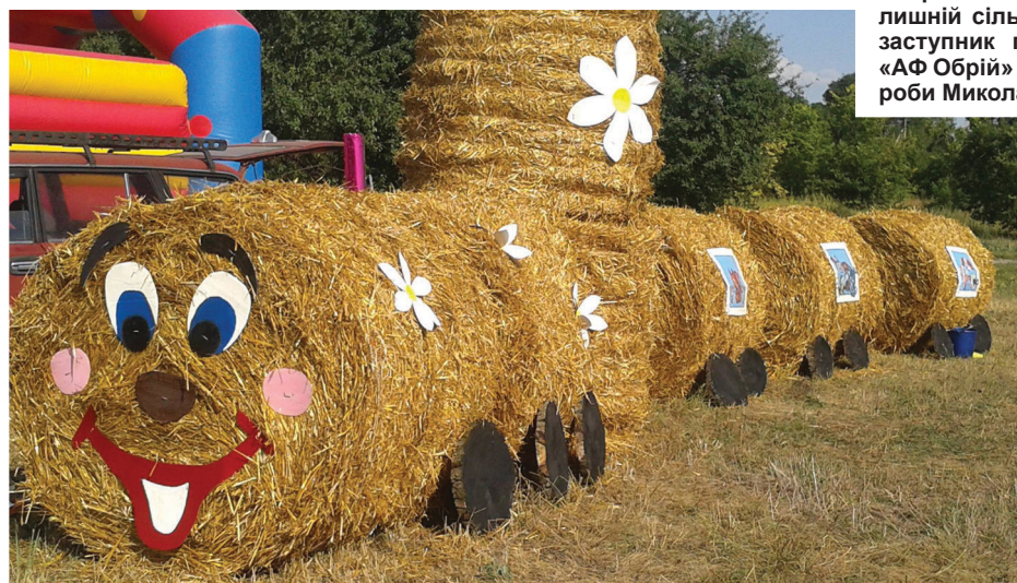
На фото: ось таким іграшковим поїздом із звичайних тюків соломки організатори прикрасили місце проведення свята.