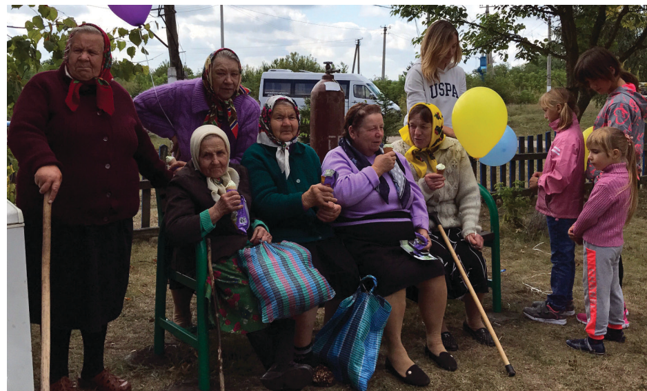
На фото вгорі: київські аніматори розважають дітей; внизу — дитяче свято принесло задоволення і дорослим.