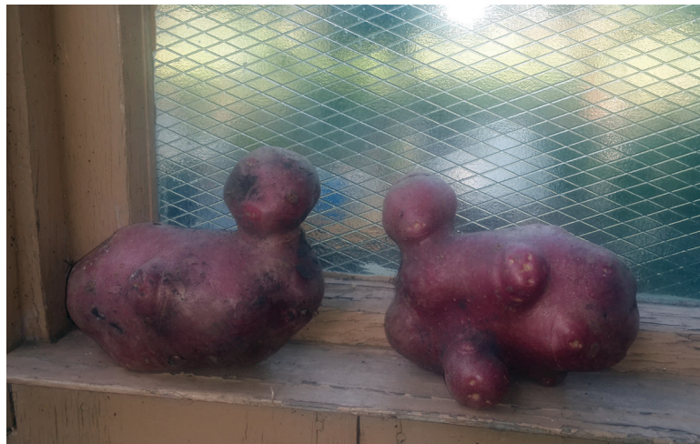
На фото праворуч: «Ми дві качки — дві лякачки»; ліворуч — чотири в одній.

Інші господарі виростили у себе на городі ось яку морквину — чотири в одному відрі. Одним вона схожа на корону, іншим — на чотири пальці руки... А що вона нагадує вам? Також ми чекаємо на нові осінні дива від наших читачів.