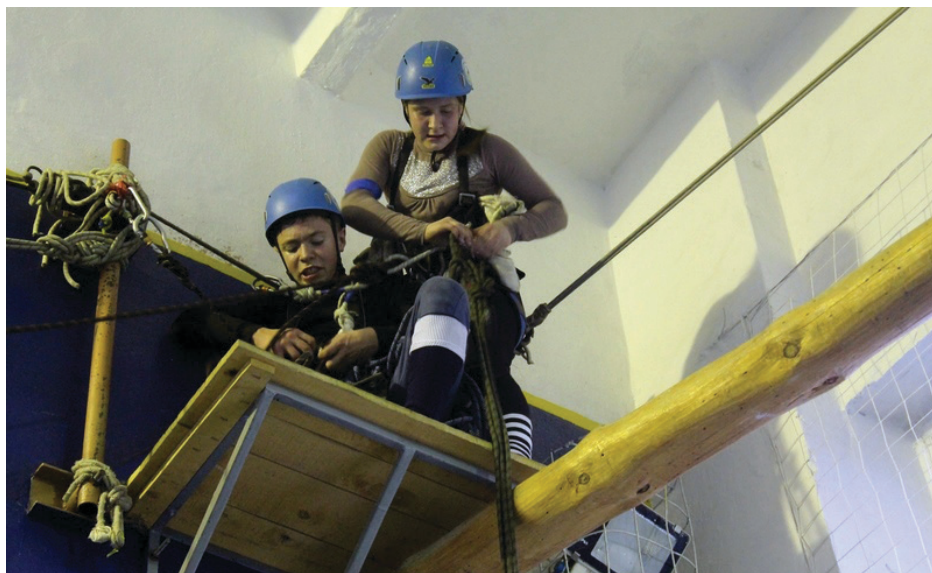
У НАС В ГОСТЯХ ГАЗЕТА «ПРИСАДИБНЕ І ДАЧНЕ ГОСПОДАРСТВО»