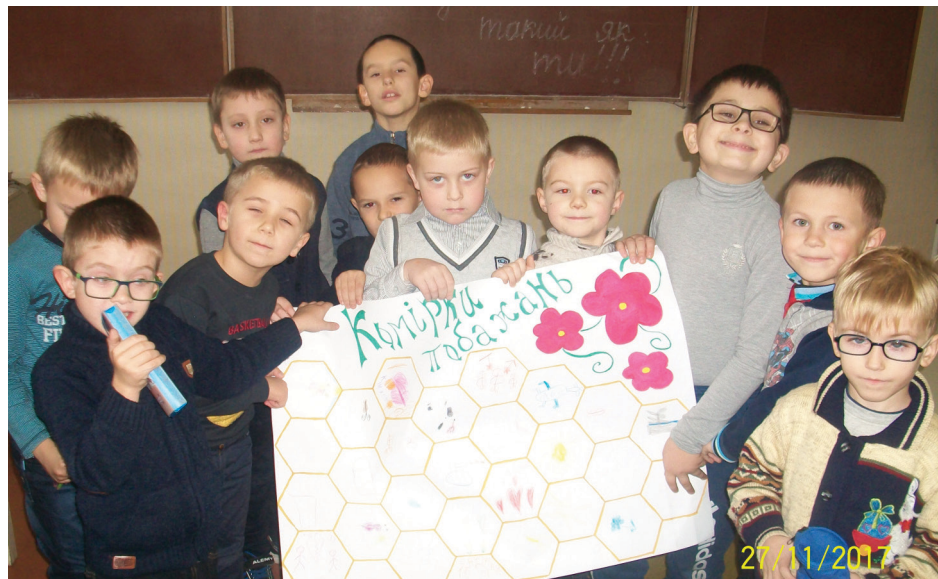
Учні Талалаївської школи створили свої «Комірки побажань».