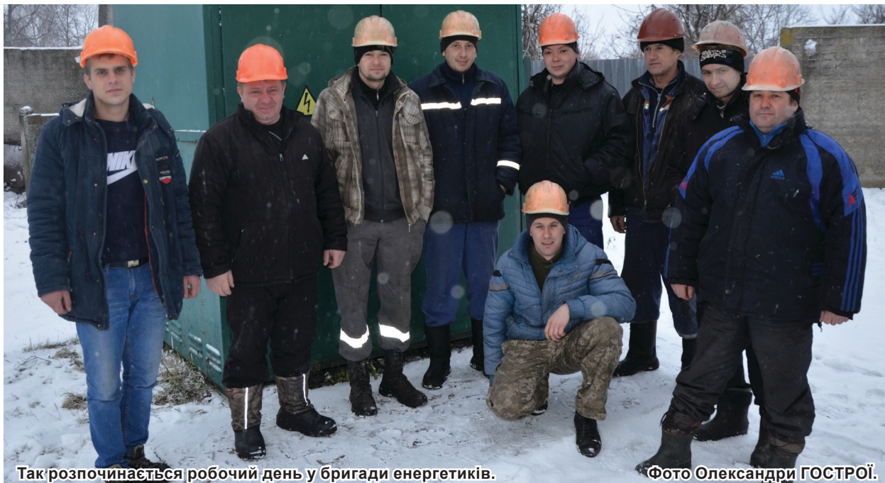
Так розпочинається робочий день у бригади енергетиків.