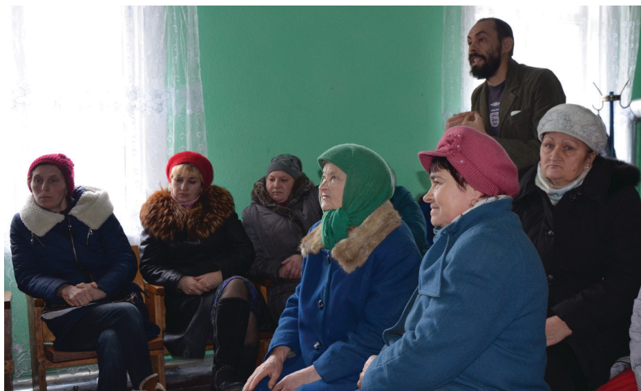
На фото: під час зборів у Слобідському клубі.

Просили дитячий майданчик. Допросилися. Привезли мішок цементу і сказали «ставте самі». Жителі села своїми силами встановили те залізо. Та чи треба казати, що вже через тиждень гірки та турніки почали лаяти на землю? При цьому сільська рада щороку списує декілька сотень тисяч гривень на благоустрій. І як користуватися тими розхитаними вітром та дощем турніками, як кататися на гоїдалці, що чиркає по землі? Ви думаєте голова не знає, що є мінімальні норми та техніка безпеки?