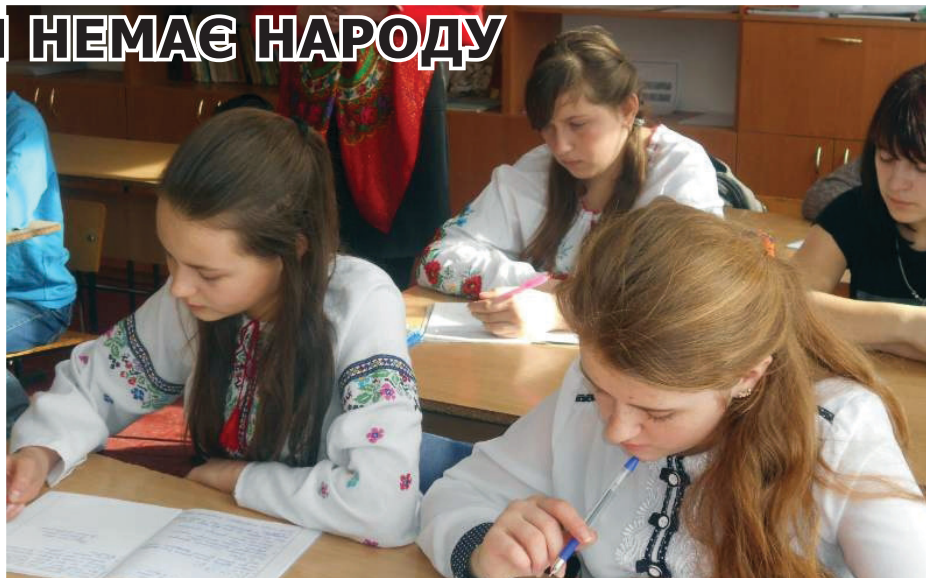
На фото: учні Української школи пишуть диктант у Міжнародний день рідної мови.

Наш земляк поет-емігрант Григорій Вишневий (родом із Займища), який все своє повоєнне життя провів в Австралії, писав у листах до редакції: «Як прилетить вісточка з України або зачую десь в емігрантських колах рідне слово — душа на небі і серце співає. Це особливо відчуваєш, коли відірваний від своєї землі. Тільки через мову ти — українець, і де б далеко не був, знаєш, що твоя Україна завжди тебе прийме, як сина». Мудрі твердження мудрої людини! З такими ж стоять сьогодні на східних наших рубежах сини і дочки своєї землі; з такими ж сіли за парти у Міжнародний день рідної мови талалаївські школярі, щоб розказати, що є для них отчий край, батьківський поріг і мамина коліска. Діти писали диктанти на патріотичну тематику «Рідна мова», «Не бійтеся