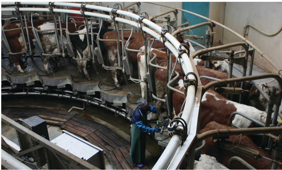
На фото: доїльний зал Харківської молочної ферми.