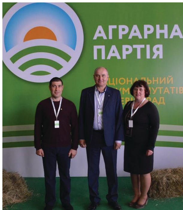
На фото: учасники Національного форуму депутатів місцевих рад.