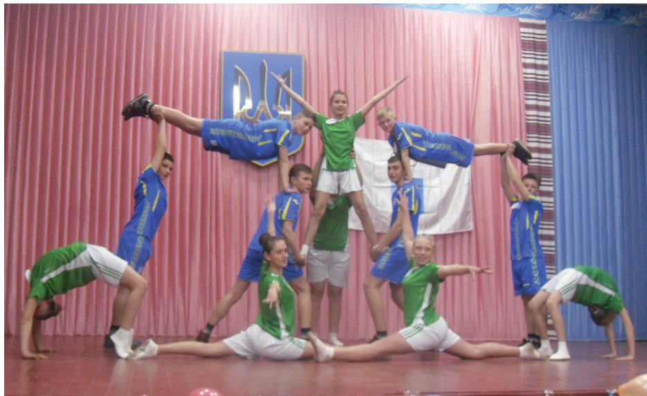
На фото: жива піраміда принесла нашій команді високі бали.