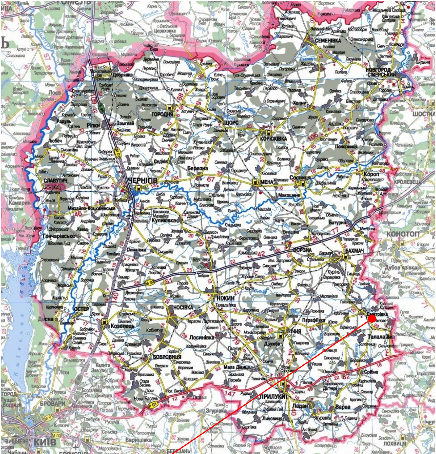
Місце розташування об'єкта